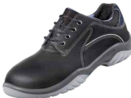
:Ergo-Tex® 480 S2

:waterproof leder :veiligheidsreflectoren :36 - 50