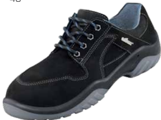
:Ergo-Tex® 470 S2

:geolied leder :klittenbandsluiting :36 - 49