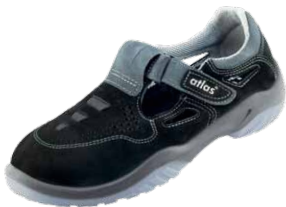
:Ergo-Tex® 360 S1

:geolied leder :klittenbandsluiting :36 - 49