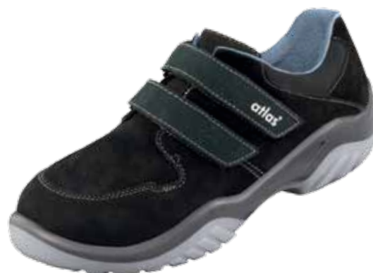
:Ergo-Tex® 400 S2

:geolied leder :klittenbandsluiting :36 - 49