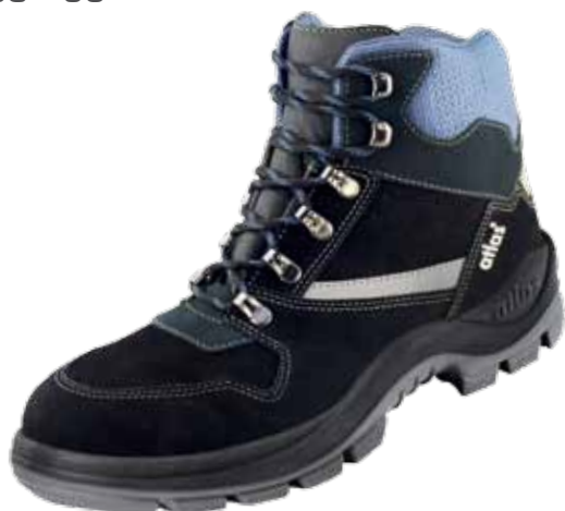
:Ergo-Tex® 580 S2

:waterproof leder :veiligheidsreflectoren :36 - 50