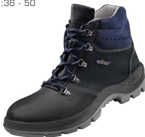
:Ergo-Tex® 600 S2

:geolied leder :veiligheidsreflectoren :36 - 50